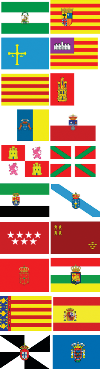
Banderes de les Comunitats autònomes, de l'Estat Espanyol, i de les ciutats de Ceuta i Melilla.