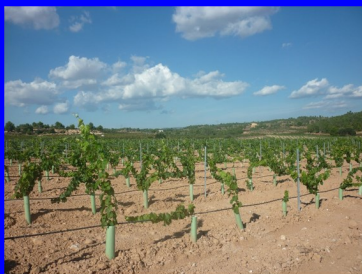
Partida de Cañada Honda (Casas de Eufemia)

Los interesados/as en la didáctica de las ciencias sociales encuentran posibilidades para desarrollar trabajos de corte innovador tanto desde la vertiente del paisaje como del patrimonio cultural. En ambos casos, las salidas de campo son una herramienta pedagógica que está al alcance de cualquier docente, desde la Educación Primaria hasta el Bachillerato.