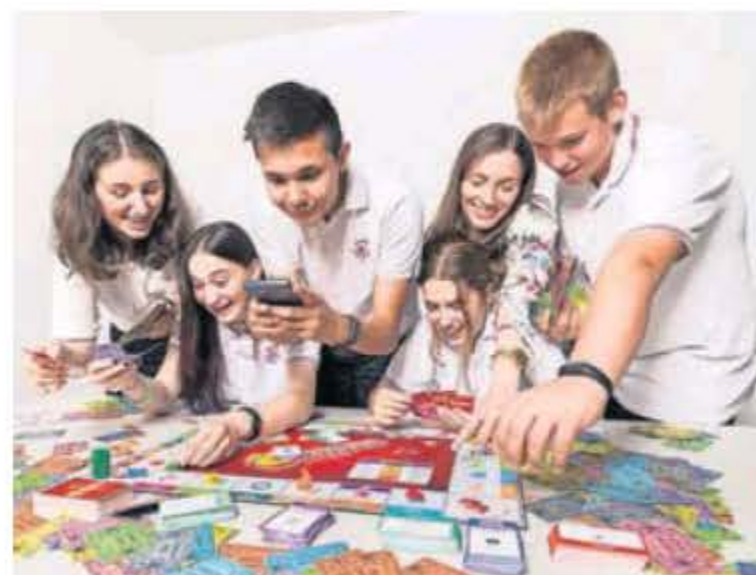
Foto del programa El seguro está en el aula , de Mapfre.

Banco Santander es la empresa que más invierte en educación en el mundo, según el 'Informe Varkey' de la Unesco