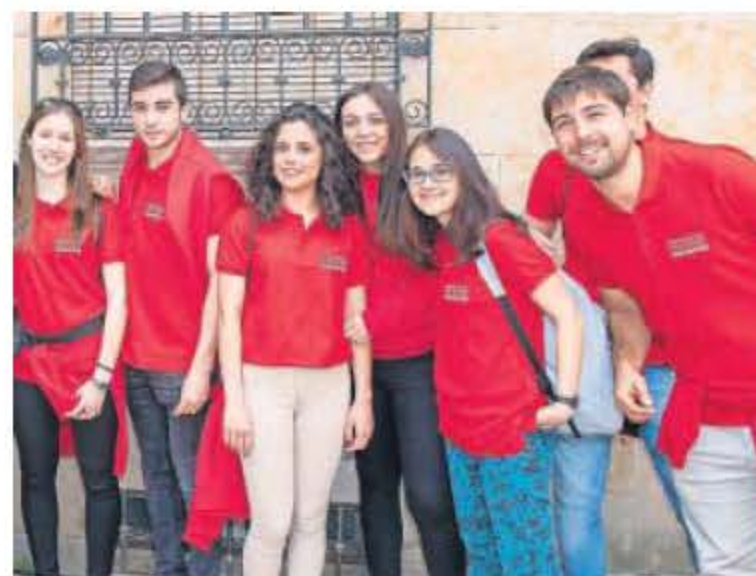
Erasmus Universta 2019.

del Instituto de Ciencias del Seguro de Mapfre. Y la apuesta de BBVA de Aprender Juntos ha logrado el Premio de la Eficacia 2019.