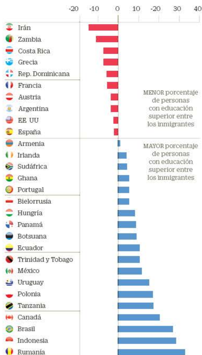
Fuente: 'Informe de Seguimiento de la Educación en el Mundo' B. T. / CINCO DÍAS

Diferencia en el porcentaje de personas con educación superior entre inmigrantes y nativos. Años 2009-2015 En puntos porcentuales